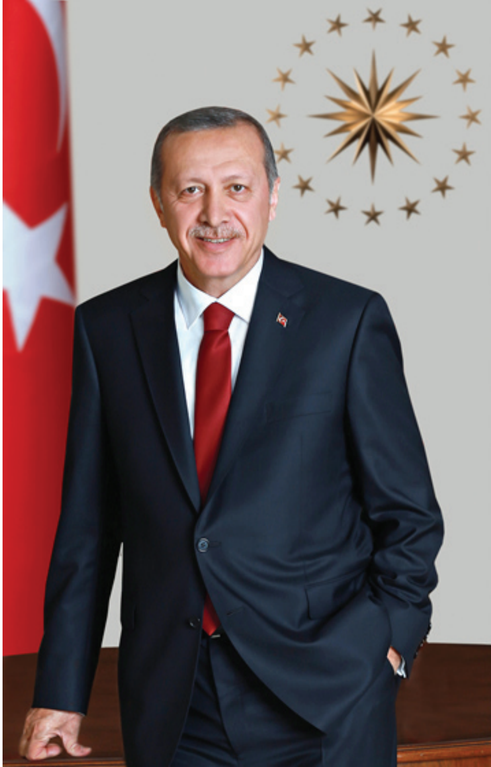
Recep Tayyip ERDOĞAN CUMHURBAŞKANI